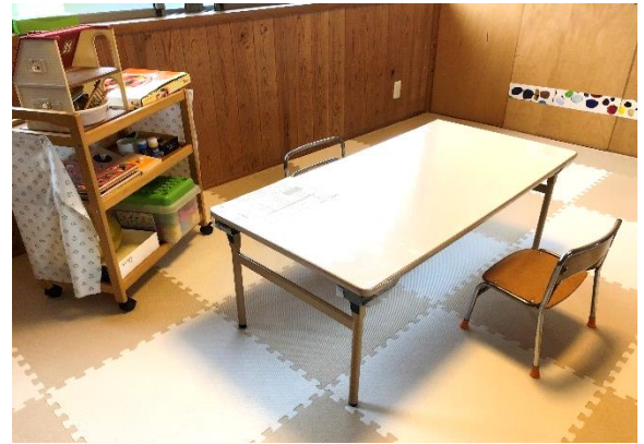
もりもりめろん広場