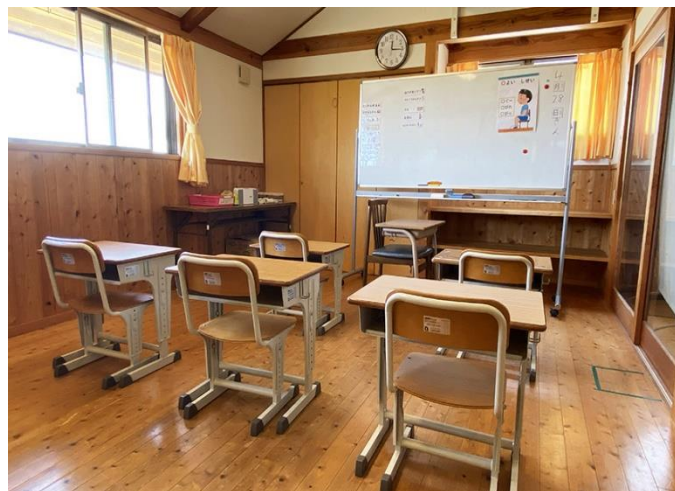
もりもりめろん広場