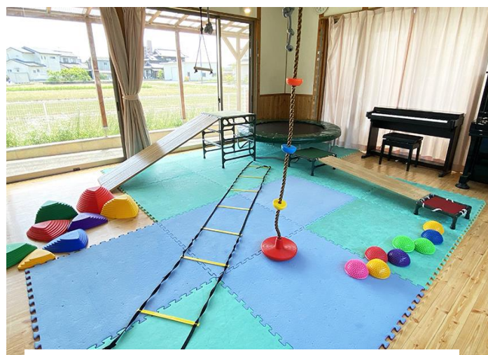
もりもりめろん広場