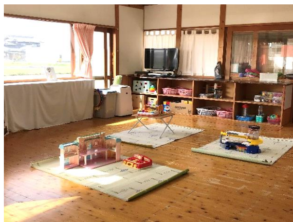
もりもりめろん広場